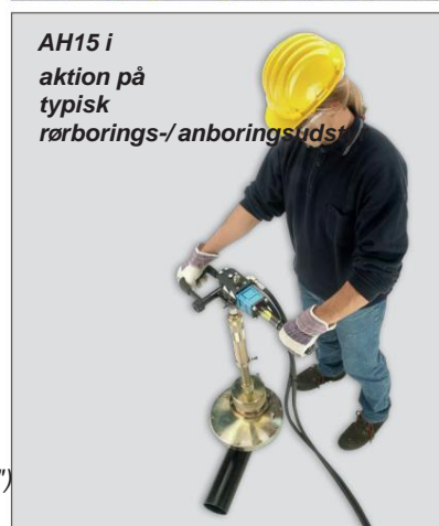
AH15 i aktion på typisk rørborings-/anboringsudst