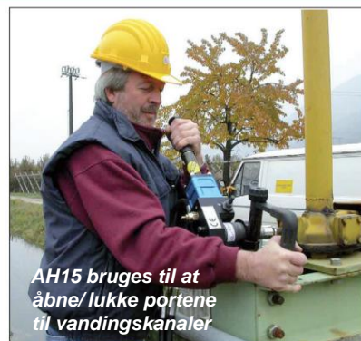
AH15 bruges til at åbne/lukke portene til vandingskanaler

AH15 er et værktøj designet til rotation i to betydninger af rørboremaskiner til anboringsforbindelsesoperationer, der normalt er nødvendige for vedligeholdelse af gas- og vandnet. For sine eksklusive egenskaber kan AH15 også bruges til rotation af andre roterende anordninger som: porte kunstvandingskanaler, løft/sænkning af jernbaneanordninger, rotation af reduktorer, mv. Værktøjet har et "twist type" kontrollhåndtag til at dreje med uret og mod uret, ON/OFF-kontrollen er proportional, så den kan øge eller reducere hastigheden i begge rotationstilstande, momentkraften og rotationshastigheden kan justeres ved at aktivere to ventiler, der styrer disse funktioner. Håndtaget med fjederretur sikrer total sikkerhed, rotationen stopper øjeblikkeligt, når operatøren slipper håndtaget ("dødmanshandling") AH15 eliminerer trætheden og øger produktiviteten.