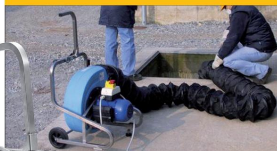
Ventilation positiv og negativ

• Luftslangerne kan monteres på indløbene på få øjeblikke og uden brug af værktøj takket være det eksklusive quick eyelet system