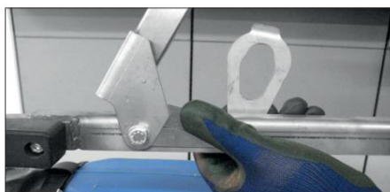
Foldehåndtag med låsesystem