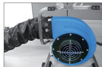
Detalje af det hurtige installationssystem af slangerne på værktøjsmundingen